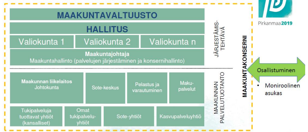
Kuva 1. Maakunnan konsernirakenne (luonnos)

Todettiin työryhmille tullut toimeksianto, johon vastaukset / kommentit tulee antaa 31.1.2018 mennessä.